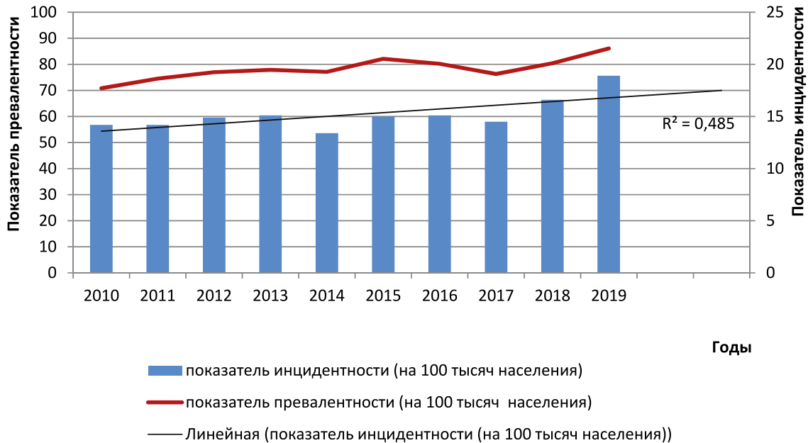
Рис.1. Динамика заболеваемости глаукомой в Азербайджане (2010-2019)

100 тысяч населения составлял 70,8, то в 2019 г. он составил уже 86,1 на 100 тысяч населения – максимальное значение на изучаемый период. Показатель инцидентности также изменялся по годам, достигая максимума в 2019 г. – 18,9 на 100 тысяч населения.