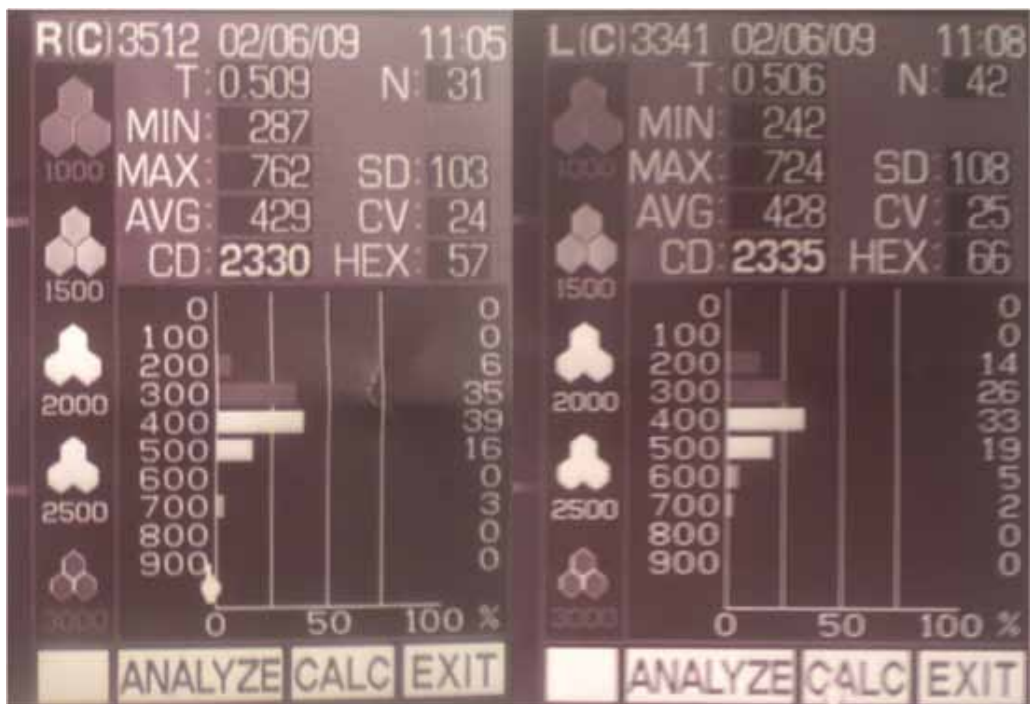
Рис.4 Состояние количества эндотелиальных клеток через год после имплантации факичной ИОЛ.