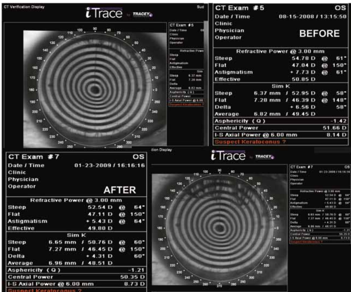
Рис.2 До и после операционное состояние кератотопографии пациента с кератоконусом имплантированной факичной линзой.

Таким образом имплантация факичных ИОЛу пациентов со средней и слабой степенью точечным конусом с превалированием сферического компонента позволяет корригировать рефракционную аметропию. Кроме того правильное расположение операционного разреза позволяет редуцировать астигматический компонент рефракционной аметропии. Полная обратимость данной операции также является одним из преимуществ этой хирургии.