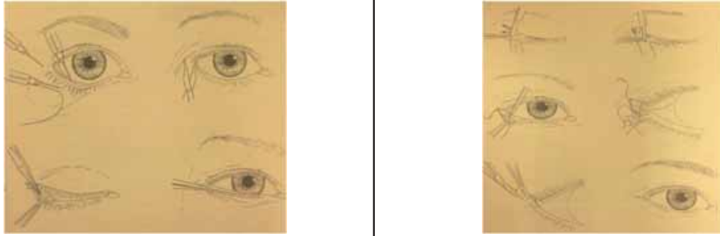
Рис.2 Горизонтальное укорочение века (Ophthalmic plastic and reconstructive surgery Byron C Smith 1998)