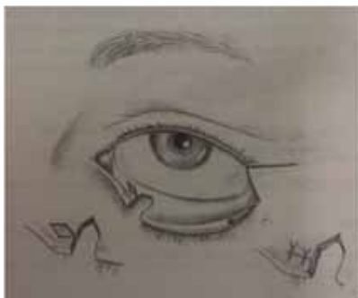
Рис.1 Операция Lazy-T (Ophthalmic plastic and reconstructive surgery Byron C Smith 1998)

Техника операции горизонтальное укорочение нижнего века (рис.2) :