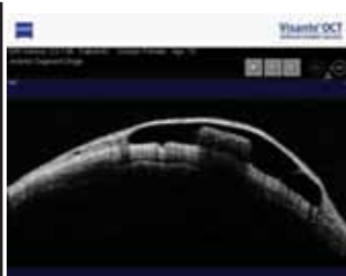
Рисунок 2. Визуализация коллагенового импланта Ологен™ на Visante OCT (1-й месяц, тангенциальный скан)