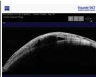
Рис.4. Визуализация коллагенового импланта Ологен™ на Visante OCT на 6-м месяце (3 глаза)