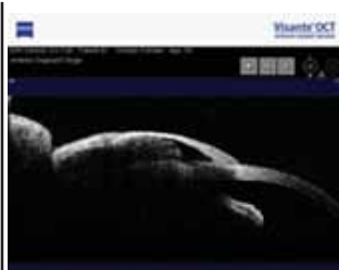
Рис.3. Визуализация коллагенового импланта Ологен™ на Visante OCT (1-й месяц, радиальный скан)