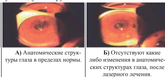
А) Анатомические структуры глаза в пределах нормы.