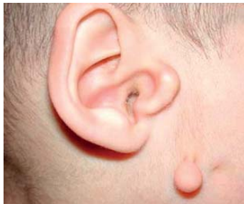
Şəkil 3. Goldenhar sindromu, qulaq anomaliyaları.

Okulo-aurikulo-vertebral sindromda rast gəlinən qulaq anomaliyaları: anotiya, mikrotiya, heliks inkişaf anomaliyası, pre-aurikulyar dəri qatlantıları, xarici qulaq keçəcəyi atreziası, daxili qulaq keçəcəyi anomaliyaları və nəticədə inkişaf edən karlıqdır. Preaurikulyar qatlantılar qulaq ilə ağız kənarı arasında xəyalı bir xətt üzrə yerləşirlər (şəkil 3) [16].