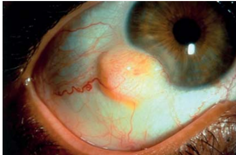
Şəkil 1. Epibulbar dermoid, limbal dermoid (Duane's Clinical Ophthalmology), [20].

Göz qapaqlarının hərəkətində məhdudiyət, qapaqların koloboması və digər göz qapağı anomaliyaları olduqda, gözün qoruyucu sisteminin tamlığı pozulur. Bu isə buynuz qişanın qıçıqlanmasına, keratit yaranmasına səbəb ola bilər və nəticədə mərkəzi görmə oxunun obstruksiyasına gətirib çıxara bilər. Bu defektlərin erkən diaqnostika və müalicəsi ikincili ambliopiya və çəpgözlüyün qarşısını alır [22].