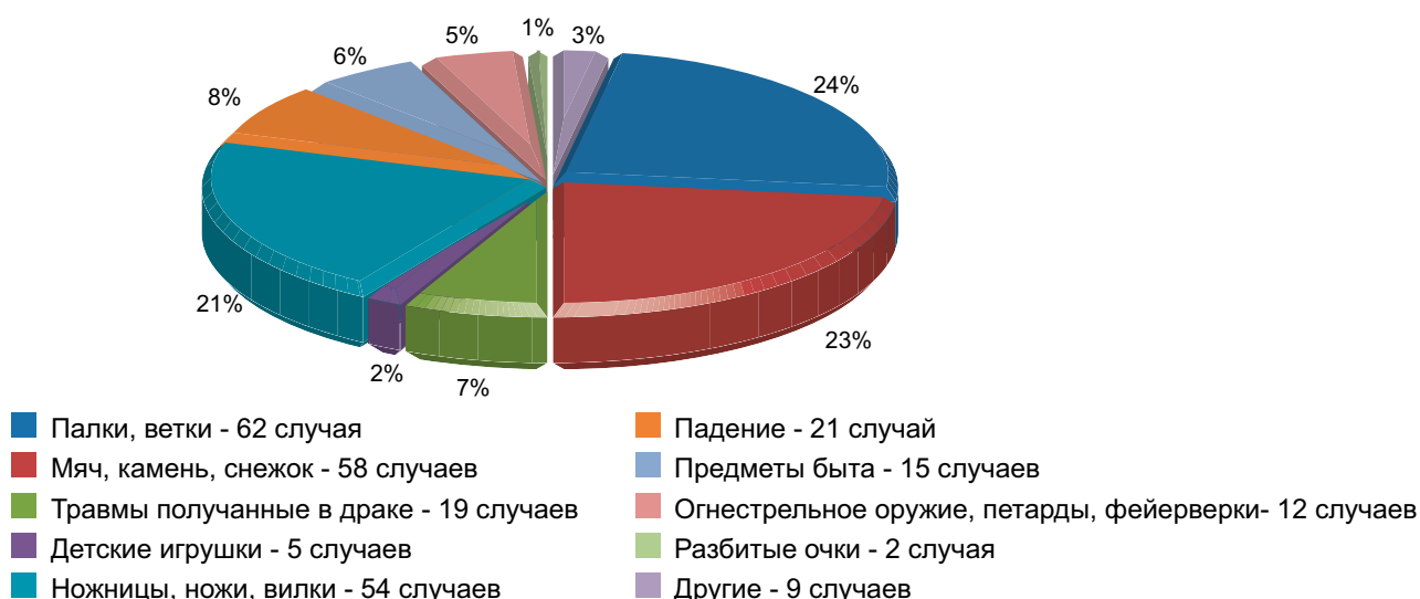
Рис. 3. Частота повреждения органа зрения у детей в зависимости от предмета, вызвавшего повреждение

Распределение пациентов по механизму травмы и предмету, вызвавшему повреждение, отображено на рисунке 3. Согласно нашим исследованиям, причины повреждений глаза у детей очень разнообразны. Часто дети получают травмы из-за недостатка контроля, невнимательности в игре, при использовании потенциально опасных предметов или вспышек ярости. Многие из травм могли бы не возникнуть при соответствующем внимании со стороны взрослых. Как видно из диаграммы 2, наиболее часто в роли травмирующего агента выступали палки, ветки, летящие предметы (мяч, камень, снежок) и острые бытовые предметы (ножи, вилки, ножницы). На долю перечисленного, в общей сложности, приходилось 68% всей детской травмы. Далее по частоте случаев травм стоят падения, драки, повреждения, полученные тупыми бытовыми предметами.