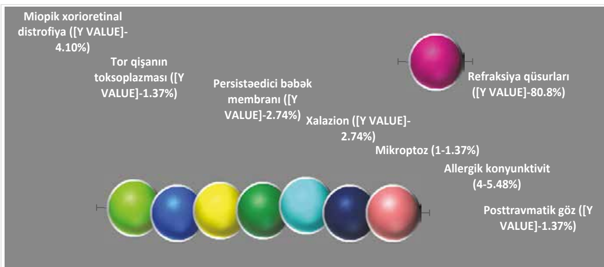
Şək. 3. Aşkarlanmış patologiyalar (14 nəfər)

Müayinə nəticəsində miopik refraksiya qüsurlarının geniş yayılması ilə əlaqədar aşkarlanmış 4 göz dibi xəstəliklərindən 3-nü xorioretinal miopik distrofiya təşkil etmişdir. Digər 1 halı isə göz dibinin toksoplazmoz ilə zədələnməsi təşkil etmişdir.