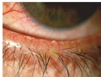
Şək. 2. Meybomi vəzinin disfunksiyası əlamətləri, xroniki blefarit