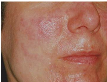
Şək. 1. Xəstənin üz dərisində acne rozasea

Bir klinik halı nəzərinizə çatdırmaq istəyirik. 42 yaşında qadın müraciət etmişdir. Şikayəti gözlərində qızartı, yanma, ağrı, batma hissindəndir. Anamnezində Acne Rozasea olduğu qeyd olunur. Müalicə aldığına baxmayaraq narahatçılığı, gözlərindəki diskomfort, şikayətləri təkrarlanır. İstifadə etdiyi dərmanlara – süni gözyaşı, gözü qızardığıca istifadə etdiyi deksametazon damlası, üzün dərisinə metronidazol məlhəmi aiddir. Hər iki gözün görməsi vahidə bərabərdir. Gözdaxili təzyiq OD-16 mmHg, OS-18 mmHg. Biomikroskopiyada –meybomi vəzinin disfunksiyası əlamətləri (hiposektor forma) qeyd olunur, sol göz artifakiya (2 il öncə əməliyyat olunub) (şəkil 2). Göz dibində patoloji dəyişiklik qeyd olunmur.