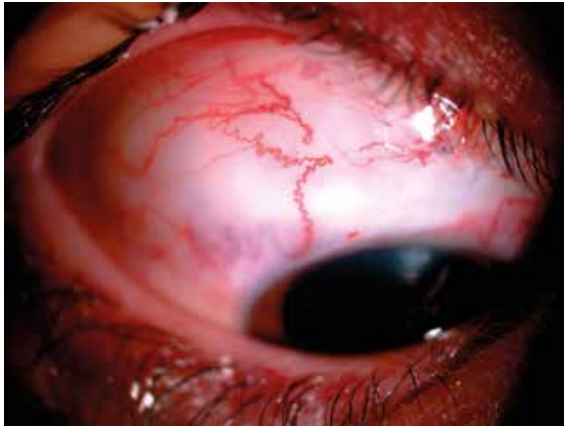
Şək. 8. Əməliyyatdan 17 gün sonra sağ gözün biomikroskopik müayinəsi