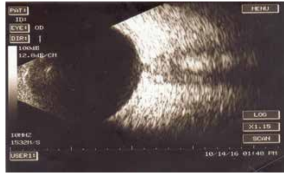
Şək. 7. Sağ gözün müalicədən 12 gün sonra B-skan