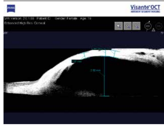
Şək. 9. Əməliyyatdan 17 gün sonra sağ gözün OKT müayinəsi

Əməliyyatdan 17 gün sonra görmə itiliyi 0,1; GDT-16 mm.c.s., biomikroskopiya müayinəsi zamanı buynuz qişa şəffaf, ön kamera orta dərinlikdə, mayesi şəffaf, bəbək medikamentoz olaraq gəndir, filtrasion yastıqcıq fəaldır (şək. 8).