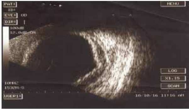
Şək. 6. Sağ gözün 4 gün sonra B-skan müayinəsi

Əməliyyatdan 4 gündən sonra B-scan (AB5500+E-Z Scan Sonomed, USA) müayinəsində sağ göz dibinin periferiyasında temporal hissədən yastı xoroidal qopma müşahidə olundu (şək. 6). Ön kamera dayaz idi. Xəstəyə konservativ müalicə təyin olundu. Sağ gözə 1%-li Prednisolone Asetate damcısı, daxilə Prednisalone tablet gündə 55 mg təyin olundu. 12 gün sonra xoroideyanın konfigurasiyasının geriyyə qayıtması müşahidə olundu (şəkil 7).