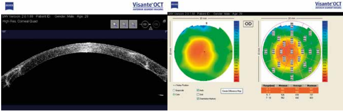
Şək. 2. DKK-dan sonra pasiyentin optik koherent tomoqrafiyası