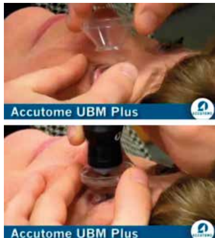
Рис.1 Иммерсионная ванночка для УБМ.

Клиническим материалом настоящего сообщения послужили результаты обследования 80 пациентов (80 глаз) в течение 6 месяцев. Средний возраст пациентов составил 66 \pm 0,3 (от 40 до 89) лет. УБМ выполнялась при подозрении на развитие синдрома Эллингсона больным, которые были прооперированы методом факоэмульсификации с имплантацией ИОЛ. Сроки имплантации, характеристики ИОЛ не учитывались. Исследование выполнялось на приборе Accutome UBM Plus (США) по стандартной методике (Pavlin С. Ī) [7].