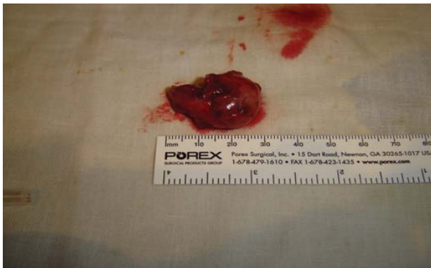
Рис. 5. Удаленная новообразованная ткань

Наблюдался спокойный послеоперационный период. Пациентка вернулась к своим занятиям через 3 дня после операции. На Рис. 6, 7 представлено состояние спустя две недели после лечения.