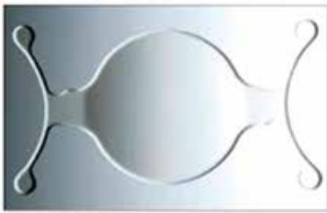
Рис. 1. Линза SACHET

Необходимо отметить, что для ее имплантации необходимы операционный доступ 5-6 мм, формирование базальной колобомы, наложение швов и их последующее снятие, что не удовлетворяет в полной мере стандартам современной хирургии малых разрезов [8] (рис.2).