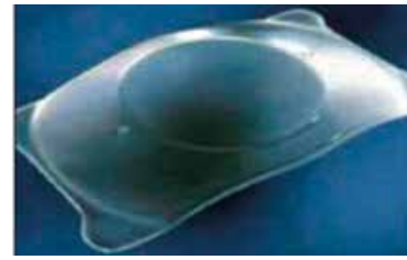
Рис. 3. Линза ICL

Заднекамерная факичная линза ICL STAAR surgical