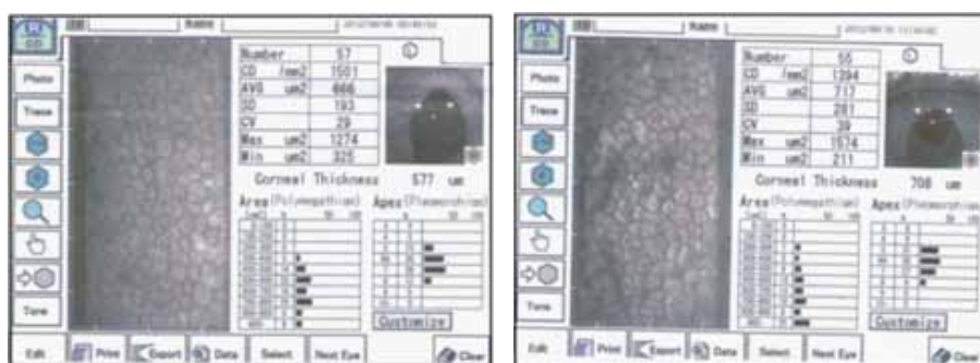
Рис.3. Результаты эндотелиальной микроскопии до и после операции

При эндотелиальной микроскопии: плотность эндотелиальных клеток снизилась до 1394 кл/мм 2 , толщина роговицы увеличилась до 708 мкм (при норме в среднем 515 мкм). Результаты OCT Visante: глубина передней камеры до операции была равной 2,75 мм, после операции 2,96 мм; угол передней камеры 36,60 и 28,90 соответственно. Внутриглазное давление оперированного глаза за весь период наблюдения на фоне 0,5% тимолола оставалось в пределах нормы.