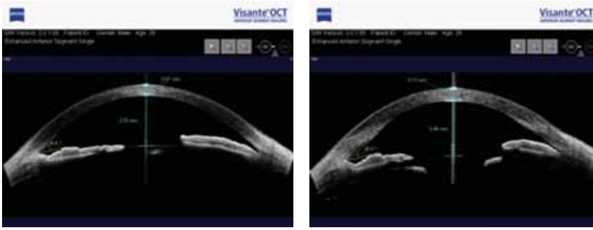
Рис.4. OCT Visante до и после операции.