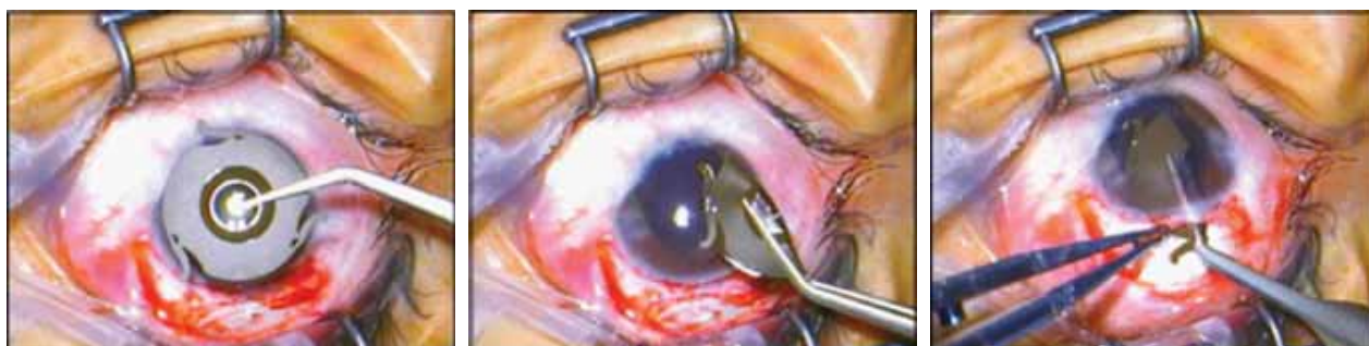
Рис.2. Внешний вид линзы МИОЛ до имплантации и в сложенном состоянии.

При первом осмотре во время биомикроскопии отмечалась незначительная конъюнктивальная инъекция глазного яблока, роговица сохраняла прозрачность, иридо-хрусталиковый протез занимал центральное положение. Острота зрения правого глаза на первые сутки после операции составила 0,7.