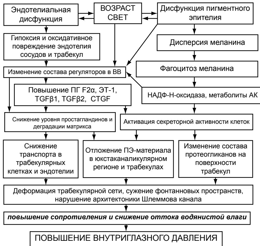
Рис. 2. Концепция патогенеза ПЭ-глаукомы

активатора плазминогена (РАI-1) [35]. С одной стороны, это ограничивает деградацию фибронектина, что способствует его накоплению в матриксе, с другой – РАI-1 ингибирует активность тканевого и урокиназного активатора плазминогена [6]. Обе изоформы катализируют превращение плазминогена в плазмин, который помимо запуска фибринолитического каскада, обеспечивает конвертирование неактивных MMP в активные формы [20]. Ключевым субстратом плазмина является MMP-3 (стромелизин). Его экспрессия в клетках трабекулы происходит как в базальных условиях, так и при цитокиновой стимуляции. TGFβ2 за счет усиления продукции РАI-1, блокирует активацию MMP-3, а TGFβ1 специфично снижает ее экспрессию [7]. В сумме этот эффект обеспечивает снижение продукции данного фермента и нарушение механизма его активации с помощью плазминогена (табл. 1). Результатом этого является накопление субстрата MMP-3 – фибронектина - в трабекулах и в ЮКР.