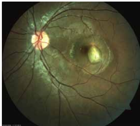
Рис. 1. Фиброзный рубец с перифокальными субретинальными геморрагиями

Биомикроскопия переднего отрезка глаза патологических изменений не выявила, оптические среды глаза прозрачные. При офтальмобиомикроскопии в центральной зоне сетчатки определялся участок отслойки нейроэпителия размером в 3ДД грязно-серого оттенка. В фовеальной области просматривался фиброзный рубец размером в 0,8ДД с перифокальными субретинальными геморрагиями (рис. 1).