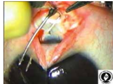
Şəkil 3. Modifikasiya olunmuş Harms trabekulotomu kanalın mənfəzinə hər iki tərəfdən daxil edilərək, üst paralel qol yönləndirici rolu oynayaraq, ehtiyatla ön kameraya tərəf hərəkət etdirildi.