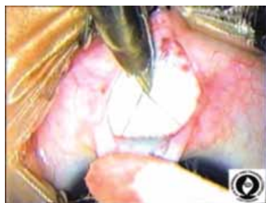
Şəkil 1. Üçbucaq şəklində hissəvi skleral loskut altında limbal anatomiya. Şlemm kanalı qara xətt (ox) şəklində görünür.

Cərrahi prosedur: Bütün hallarda istifadə olunan cərrahi texnika birincili KTT idi. Əməliyyatların hamısı bir cərrah (M.N.A.) tərəfindən yerinə yetirilmişdir. Yuxarı kvadrantda tağ əsaslı konyuktival loskut hazırlandıqdan sonra, 4x4 mm ölçüdə üçbucaqşəkilli skleranın yarı qalınlığında buynuz qişaya doğru loskut şəklində disseksiya aparıldı (Şəkil 1).